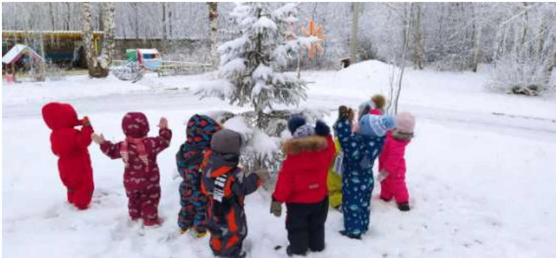
1. Рассматривание ёлочки