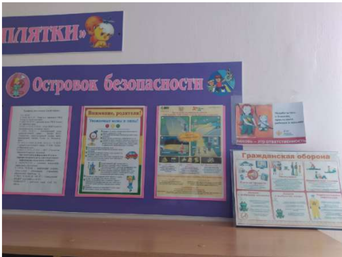
Работа с родителями: