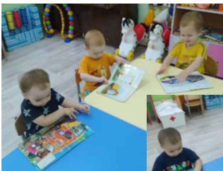
Рассматривание книг «Умные машины», «Полезные машины»